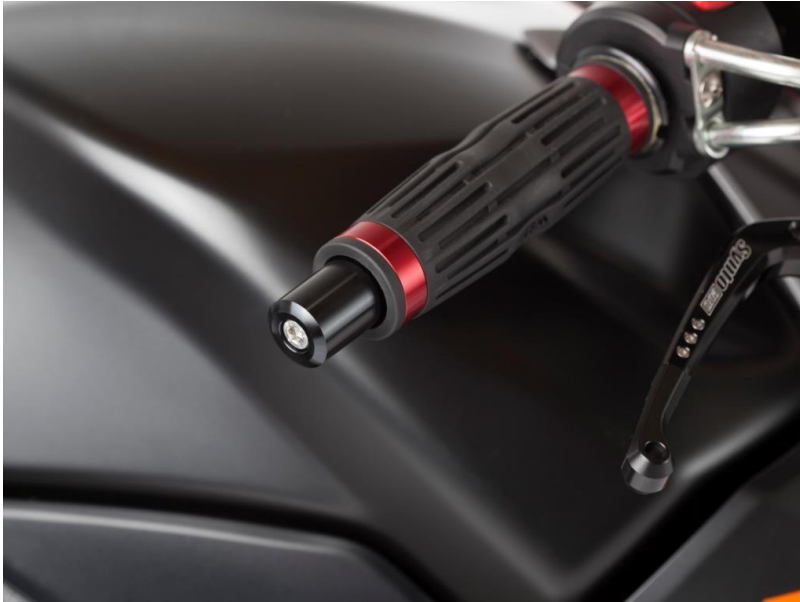
Bild 3 von 4: Verbreiterung ‚largo‘ universell an alle 22er Lenkrohre montierbar