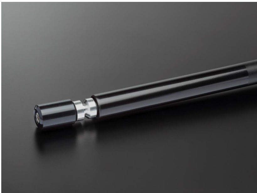
Bild 1 von 4: Lenkrohrerweiterung um 30 mm je Seite (gesamt 60 mm)