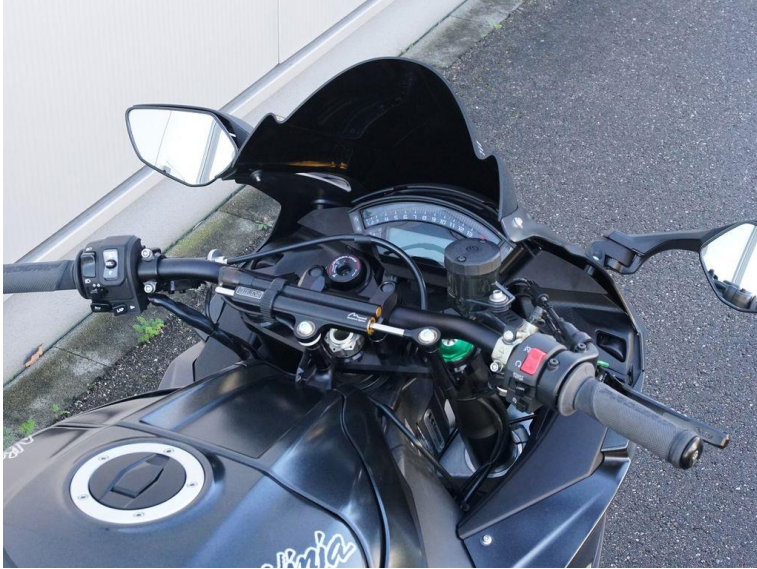
Bild 4 von 6: Alle nötigen Umbauteile sind im Kit enthalten (Ausnahme: Lenker)